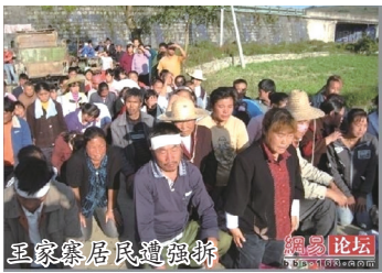
10月21日，贵阳市乌当区政