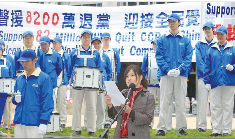
10月17日澳大利亚墨尔本举办声援8200万勇士退出中共集会

2004年底，中文媒体《大纪元时报》发表《九评共产党》系列社论，引发的三退大潮以