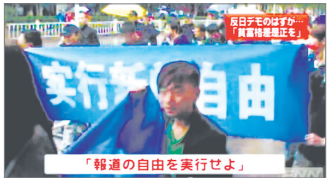
宝鸡反日游行标语触及新闻自由议题

近期在中国各城市持续蔓延的反日游行，抗议目标开始转向，从反日转向关注中国国内议题。