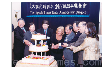
纽约庆祝大纪元创办十年

此次宝鸡游行目标的转向，在2005年深圳发生的大型反日示威游行中已有前例，当时后来有人转向高喊：“共产党懦弱”、“党和政府不爱国”。