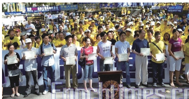
十多位民众在纽约集会上领取三退证书