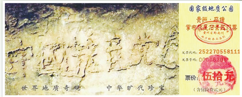
贵州掌布风景区门票上印有藏字石

2002年6月，中国贵州省平塘县掌布风景区发现五百年前崩裂的巨石断面惊现“中国共产党亡”六大字。经三批地质专家鉴定藏字石为2.7亿年前天然形成。