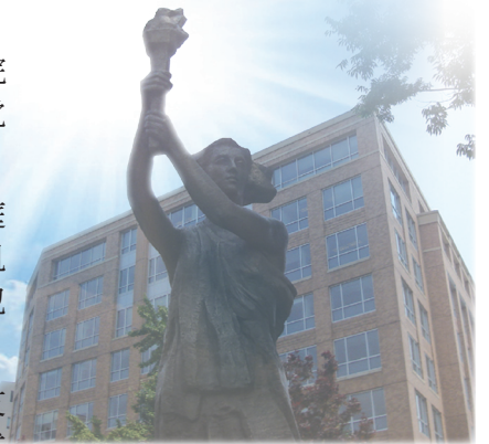
美国共产主义受难者纪念碑

2008年6月30日波兰上诉法院宣布起诉波兰最后一位共产党领导人伊切赫·雅鲁泽尔斯基。