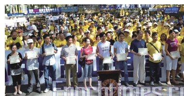
十多位民众在纽约集会上领取三退证书