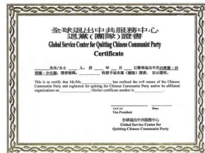
三退证书具美国有效法律文件

全球退党服务中心纽约总部提供服务项目：为声明三退的民众办理具有法律效用的《三退证书》。据美国移民局反馈，他们非常高兴能有这样的证书，解决辨识申请人身分真伪（证明不是共产党员）的困难。《三退证书》由全球退党服务中心总部统一制备和签署，可直接向纽约退党服务中心总部查询，也可通过当地退党服务中心义工办理。