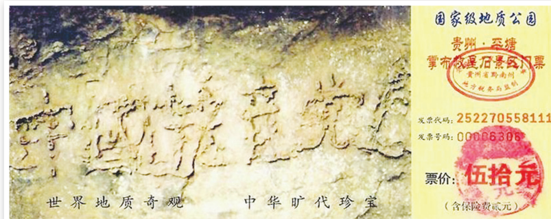
贵州平塘县风景区门票

仰望深邃的苍穹，亘古的日月，生命的轨迹，如同岁月沧桑的嬗变，遥遥相传，代代生息，愿2011年越来越多勇士们投入到三退大潮中，让我们共同见证，中共解体后中华民族毅然矗立在世界之巅时刻。