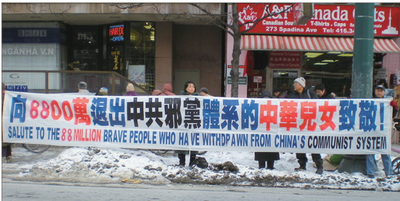
加拿大多伦多民众声援中华儿女三退

2004年底，大纪元时报推出了“三退（退出中国共产党/团/队）”这一伟大的中华民族精神觉醒运动，截至今年2月初有