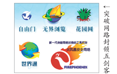
突破网路封锁五剑客

成为中共政权的死穴。若网路封锁失效，则中共政权岌岌可危。事实上，只要给中国百姓几天时间，免费阅读海外各种真相网站和媒体资讯，中共这么多年来精心筑起的“谎言大厦”就会轰然倒塌，等待中共的就是历史的大审判。