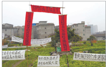
村民用春联表心声 曝光政府恶行