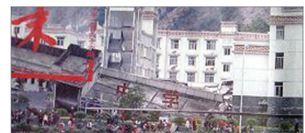
四川漩口中学倒塌，后面是坚固豪华的办公楼

5月12日，四川省汶川县发生地震。震前中科院耿庆国等多位地震专家曾多次上书中央，预报四川将发生大地震，四川漩口中学倒塌，后面是坚固豪华的办公楼。奥运前为稳定人心，中共隐瞒预警。调查显示，川震中七千多间校舍坍塌是施工时偷工减料的“豆腐渣”工程造成，劣质水泥、钢筋使校舍在五秒内彻底坍塌，让人毫无逃生机会。