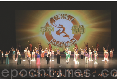
神韵在法国里昂演出圆满落幕

神韵官网： http://www.shenyunperformingarts.org