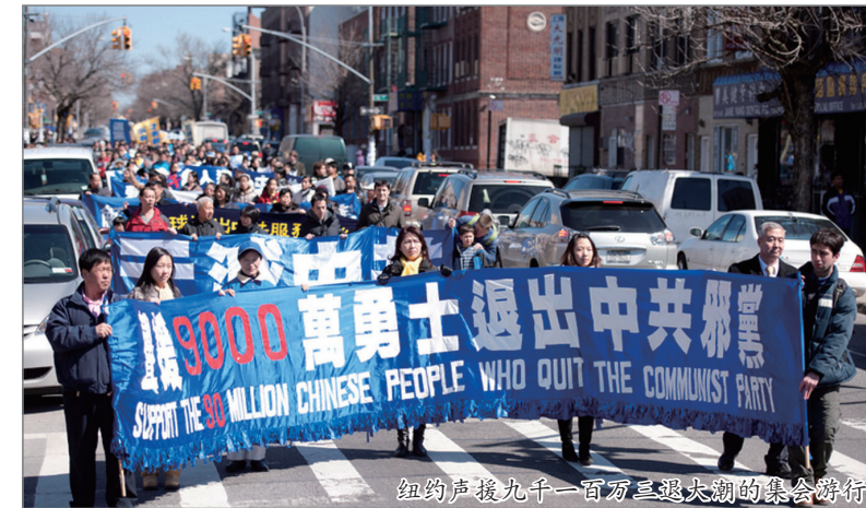
纽约声援九千一百万三退大潮的集会游行

自大纪元时报2004年发表社论《九评共产党》以来，到今年三月已超过9100万人发表退出党、团、队的三退声明，大