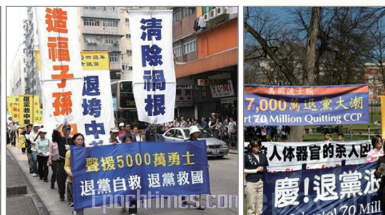
香港游行声援五千万人三退