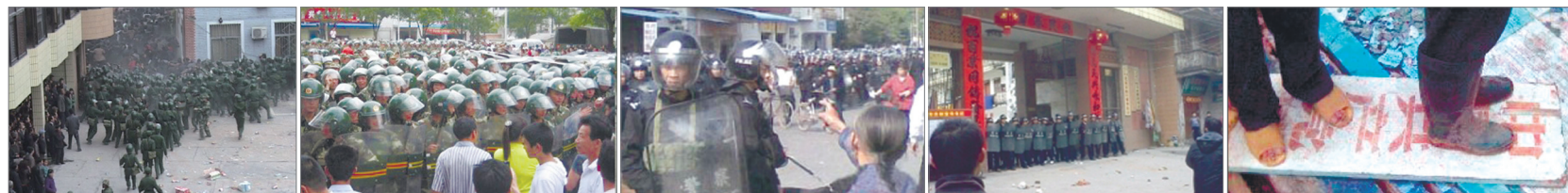
2008年11月甘肃陇南拆迁补偿不当 五万农民聚集遭镇压 2009年6月湖北石首离奇命案 七万名民众抗议 警方镇压 2010年12月广东佛山顺德陈村因徵地爆发严重冲突 2011年2月广西数千村民抗议徵地赔偿遭问题遭镇压 2007年5月广西博白5万名人民群众反对当地政府暴力计生

2007年广西博白五万民众为抗议中共暴力计生，将中共牌子摘除踏在脚下。2008年12月杨佳袭警案二审，约一千多人聚集上海市高等法院门前高呼：“打倒共产党”、“打倒法西斯”。面对中共独裁政权下日益严重的拆迁徵地、贫富差距、贪腐、黑社会流氓镇压问题，民众不满情绪日渐高涨，开始公开呼吁：“打倒共产党”。中共对民间社会不满，没有想方设法疏导，反倒视为足以摇动政权安危的敌我矛盾加剧打压，导致社会动荡、冲突一触即发。