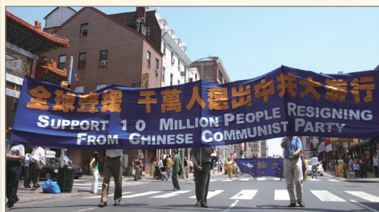
三退人数超过千万 美国费城举行游行声援