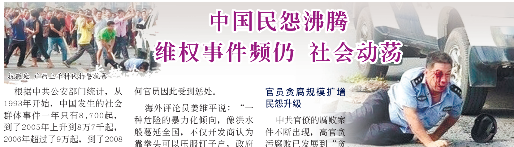
抗徵地 广西上千村民打警抗暴

在2009年，中共就曾公开发布《2010中国危机管理年度报告》称，平均五天发生一宗大影响危机輿情事件。据法国广播公司报道，面对“民怨很大”，中共目前在各大城市部署了37万警察，这还不包括那些密切监视老百姓动向的街道