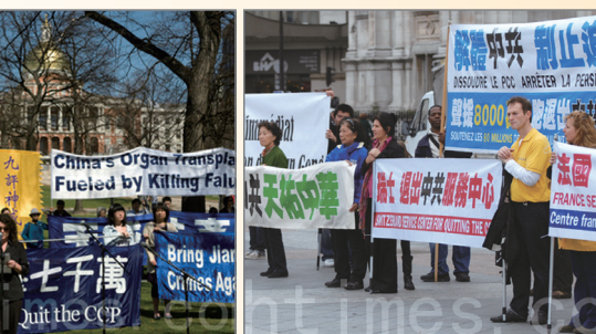
波士顿集会声援七千万勇士三退