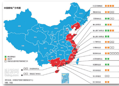
中国核电站分布图

国1964到96年间的核武试爆，给周边居民带来巨大的健康损害和环境污染，因接触到核落尘有19万人因辐射相关疾病辞世。据报道，中共核爆时的试验基地，如今却成为旅游景点，接待了逾40万游客。