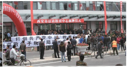
中国西安市信访接待中心出现打倒共产党标语

近年来在中共的独裁政权下，中国数以千万计的上访群体有冤无处申，长年遭到中共暴力殴打、绑架、关黑牢、酷刑等迫害，绝望下，访民采取极端方式抗议的案例屡见不鲜，有跳水大桥自杀，有上天安门城楼撒传单，甚至有以自焚表达冤情的。中共从来只是把人民当成其奴役的对象，把民意利用来成为其独裁统治的工具。中共体制不允许任何人为民众出头，在中共体制中，保住政权比百姓的性命重要几万倍。