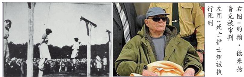
右图：约翰·德米扬鲁克被判死刑。左图：死亡护士组被执行的罪行。

今年90岁的乌克兰人约翰·德米扬鲁克，于1943年3月至9月在德军占领的波兰索比布尔纳粹集中营担任警卫，涉嫌利用毒气协助杀害2万7千9百名犹太人。2011年3月22日德国慕尼