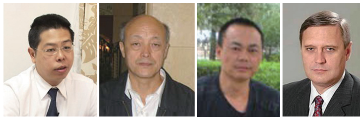
林子健 马晓明 胡军 米哈伊尔·卡西亚诺夫

三退人数超过九千万，中外各界人士纷纷给予支持，他们赞扬三退运动帮助中国人摆脱对中共的恐惧，给中国带来新的希望。他们并呼吁更多中国民众加入到三退浪潮中，最终和平解体中共。