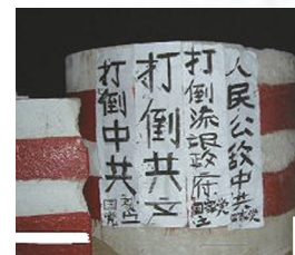
南方民众张贴打倒中共标语

中国茉莉花革命自2月20日在多个城市发起后，虽因中共高压封堵，尚未出现大规模活动，但集会城市仍不停增加，而海外如纽约、香港、泰国等地也不断有声援活动。