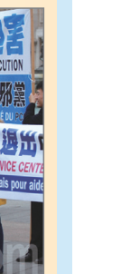
巴黎民众庆祝三退人数超过八千万