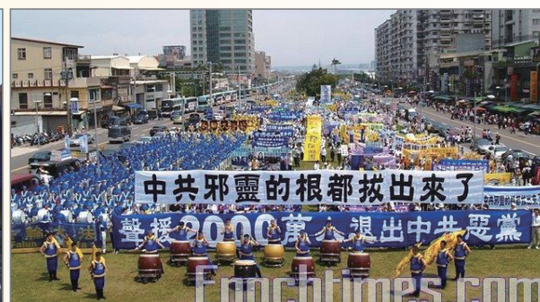
台湾声援二千万人三退集会