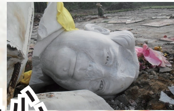
海南毛泽东像遭摧毁

中共建政以来接二连三的血腥政治运动，三反、五反、肃反、反右、大跃进带来的三年大饥荒、文革和后来的“六四”镇压学生、导致有八千万中国人非正常死亡，超过人类两次世界大战死亡人数的总和。