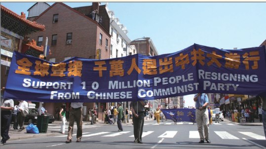
三退人数超过千万 美国费城举行游行声援

2006年3月，湖北黄陂粮食系统100多名工人向武汉市委公开提出退党。2006年7月，广西隆安县那桐镇47名村民，在失地抗争无果后，联合签名向隆安县委退党。2008年11月，上海著名维权律师郑恩宠宣布用真名三退，以表明支持退党浪潮的决心。2008年12月9日，38名上海访民在香