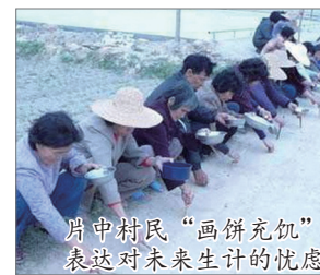
片中村民“画饼充饥”表达对未来生计的忧虑

益建设”名义共徵去130多亩地。至今拖欠补偿款近30万元，全村耕地仅剩约60亩，人均不足6厘。村民说，一直没有人理会他们的要求。而记录片在部份论坛已被删除，疑遭当局封杀。