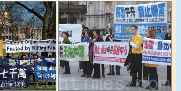
巴黎民众庆祝三退人数超过八千万