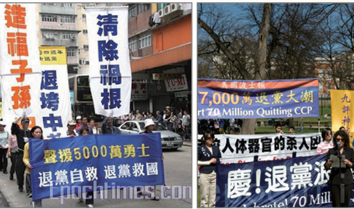
波士顿集会声援七千万勇士三退