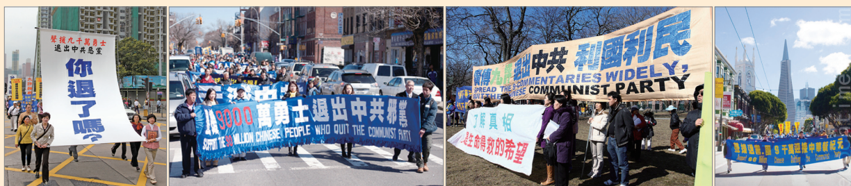
声援三退集会游行：2011年海外声援中国三退大潮集会游行，由左图至右：香港、纽约、加拿大、旧金山