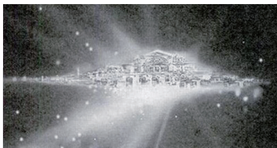
◀ 1993年12月，美国哈勃太空望远镜聚焦在遥远天际的一个星团，拍摄到宇宙中璀璨的天国世界。

中共承其衣钵宣扬无神论者，它通知党员不要有宗教信仰，并要求开除属于宗教团体的党员。但是部份党员却成功地兼顾信仰和党员身份。外交关系委员会中国研究中心资深