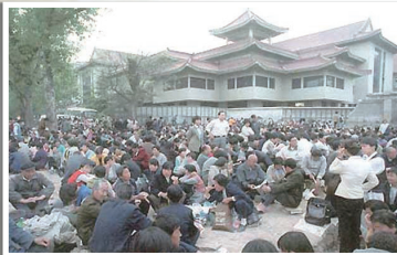
4.25上访的群众秩序井然