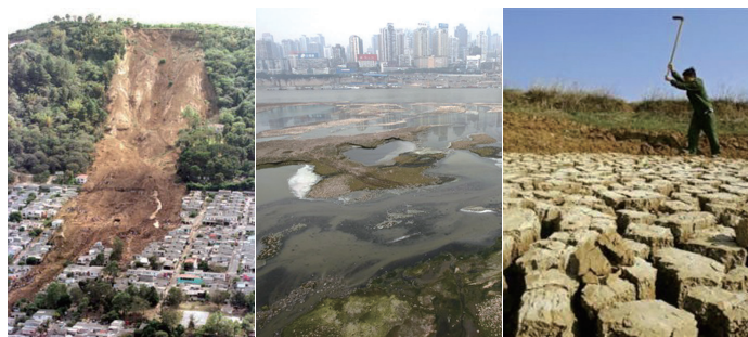
中共战天斗地，天灾人祸不断，左图起：舟曲泥石流、长江污染、西南大旱

由此不难理解，凡是产魔教统治下的社会，为什么总是伴随着最深重的社会灾难和天灾人祸，因为邪灵附体的人必然道德败坏，不敬上天，反天、反地、反人类，魔教泯灭人性，人情冷漠，内部成员自相残杀，政治运动不断，战乱不已，因此魔教国家总是生灵涂炭，民不聊生，更由于其狂妄无知、战天斗地、破坏生态环境，也会引发严重的天灾。