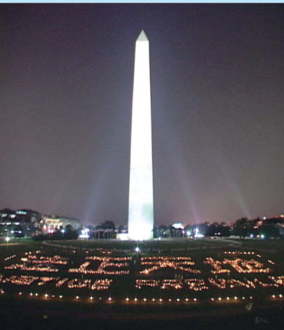
2003年7月美国华盛顿烛光守夜