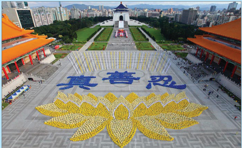
2010年11月台湾法会近六千人排字