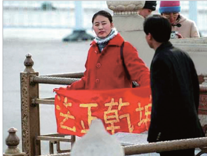
法轮功女学员在天安门金水桥上和平请愿