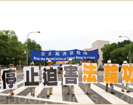
美国华府大游行呼吁制止迫害