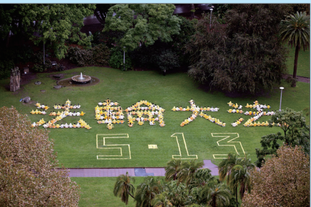
2011年4月悉尼排字庆祝世界法轮大法日