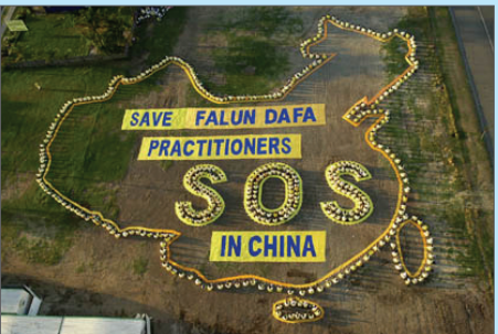
2001年10月澳大利亚亚太法会期间排字