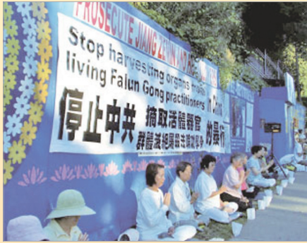
加拿大中领馆前集会呼吁停止迫害