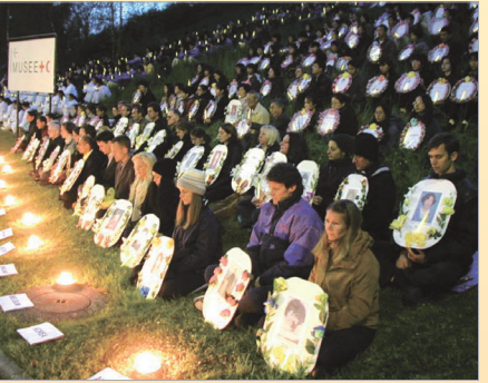
法轮功学员在日内瓦烛光悼念守夜