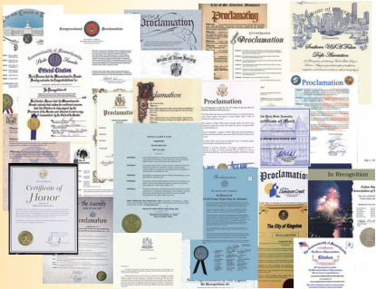
美国 加拿大各界褒奖