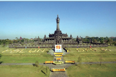
2003年1月印尼法会期间排FALUN DAFA