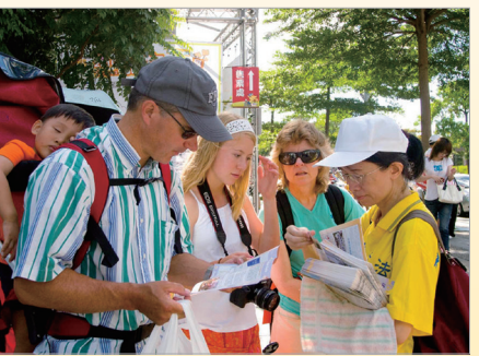
海外民众阅读真相资料