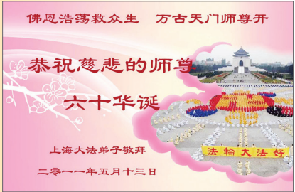
来自中国法轮功学员的贺卡

5月13日是法轮大法开传纪念日，同时也是法轮功创始人李洪志先生的生日。2000年全球法轮功学员倡议将每年5月13日定为“世界法轮大法日”，以纪念这一高德大法洪传人世，让更多的人看到法轮大法带给上亿人健康和精神的巨大变化和了解法轮功的真相，知道在中国以外都可自由习炼，希望世界更多政府和人民支持中国法轮功学员争取信仰自由权利。