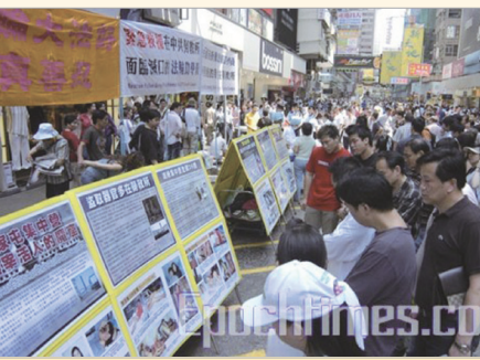
中国游客在香港观看真相展板