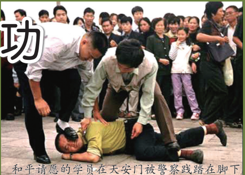
和平请愿的学员在天安门被警察践踏在脚下

法轮功自1992年从中国传出后.由于祛病健身、提高道德方面具有神奇效果.迅速普及全国，并受世界各地人民欢迎与赞誉。然而在1999年后，法轮功学员在中国为什么会遭到极不人道的残酷迫害呢？