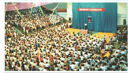
1994年7月大连第二期讲法班