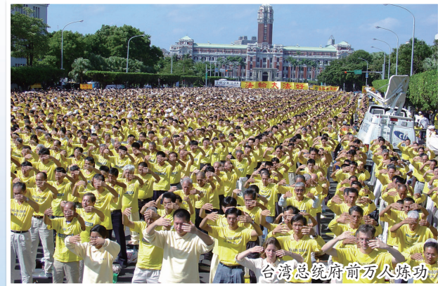
台湾总统府前万人炼功

个大法社团，因教化人心效果显著，台湾各地监狱陆续将法轮功纳入教化课程中。法轮功在台湾普遍受到政府部门及社会各界的高度肯定！