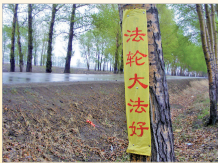
大陆随处可见“法轮大法好”横幅

相；数十年如一日，不论寒暑风雨无阻，不求任何回报，只希望世人不要被中共的谎言蒙蔽，明白法轮大法的美好。