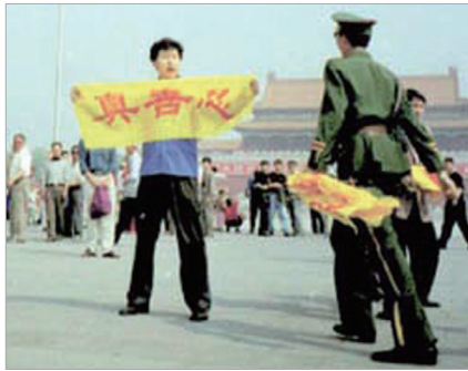
顶着被抓捕的压力在天安门广场拉真善忍横幅的法轮功学员