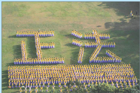
2006年11月香港千人排字