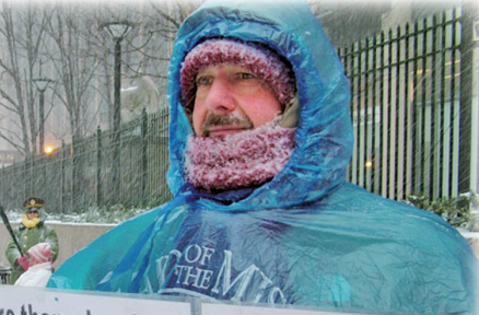
法轮功学员在曼哈顿风雪中讲真相

中共在打击修炼“真善忍”的法轮功学员时，同时也助长了邪恶，使假、恶、暴、毒、邪、腐败等乘机泛滥，进而摧毁了社会的道德体系，使所有善良在不知不觉中承受迫害，导致道德急速下滑的社会危机。中共对法轮功的迫害，其实也是对全中国人的迫害，甚至是对全