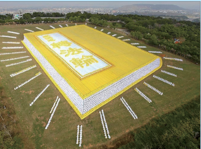
2009年11月台湾六千人排《转法轮》