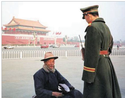
长途步行到天安门广场为法轮功和平请愿的老人