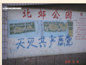
内蒙北郊公园三退标语