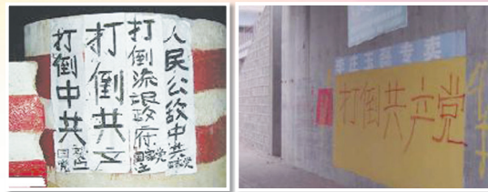
中国各地出现“打倒共产党”标语

共产党国家崩溃的前兆之一就是党员大规模的退党。捷克斯洛伐克有人口1500万，在共产党解体前一个半月，有66000人退党。匈牙利有人口一千万，党员78万，在解体前的一年半有12万人退党，前东德有人口1670万，党员240万，在垮台前两