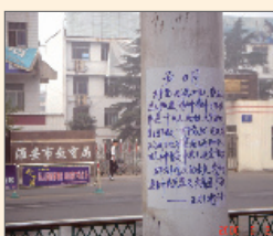
江苏街头三退声明