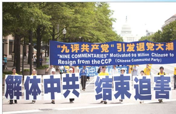
7月15日，三千多名来自世界各地的法轮功学员在美国首都华盛顿举行游行，要求停止迫害法轮功，并声援接近一亿人退出中共及其相关组织。