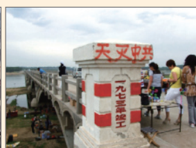
东北地区三退标语