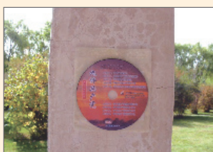
山西朔州公园张贴九评光碟