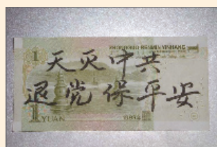
人民币上的三退标语