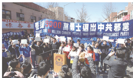
纽约集会上30多位中国人公开三退

随着退党大潮的推进，觉醒的大陆民众逐渐摆脱对中共的心理恐惧，支持正义的行为越来越公开化。