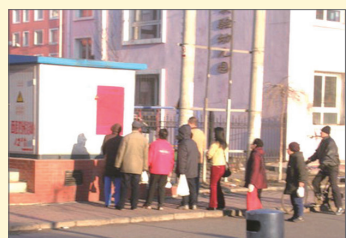
吉林街头三退声明

词句、天灭中共标语更是随处可见。许多人还自发传播《九评》，甚至成立退党中心，帮助亲友及周遭的人们三退。