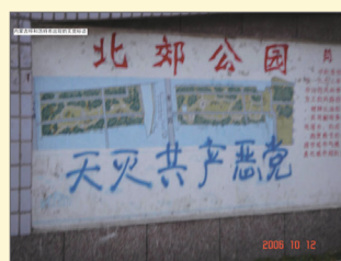
内蒙北郊公园三退标语