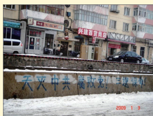
北方某市三退标语