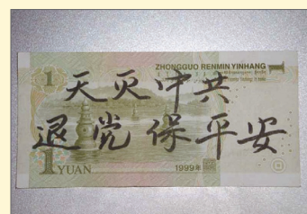
人民币上的三退标语