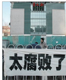
北京秀水商场商家挂出“太腐败了”的布条

如今中共内部贪腐，贫富差距大、失业率高，民间维权事件遽增显示中国社会动荡不安、民怨沸腾，加上一亿中国人三退唾弃中共。民意上映天象，得民者昌、失民者亡，善恶有报、暴政必亡，中共难逃解体命运。