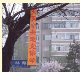
东北地区三退标语