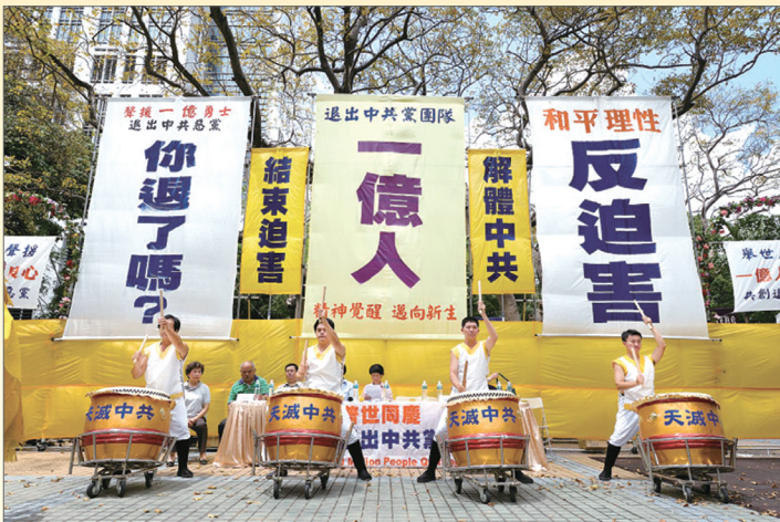
香港8月21日发起声援一亿人退党大游行，庆祝这一亿人获得新生

2004年11月大纪元社论发表《九评共产党》引发中国民众精神觉醒，兴起三退(退出党、团、队)大潮，2011年8月7日，在大纪元退党网站上声明三退的人数超过一亿人。全球各地如美国、加拿大、香港、马来西亚、澳洲、韩国、日本、台湾等多个国家与地区纷纷举行集会游行等活动共庆这大规模的人类精神觉醒运动的历史时刻。这场道德回归、精神升华的运动，正在引领一场划时代的社会巨变。