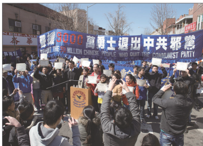
2011年3月27日，纽约9千万退党集会上30多位中国人在现场公开三退