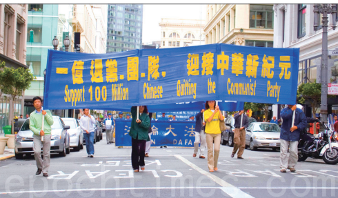
8月21日，旧金山举行庆祝活动祝贺一亿中国三退