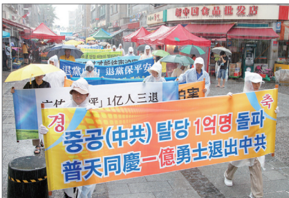
8月14日，韩国各界民众在安山市举行集会游行，声援一亿多中国人三退