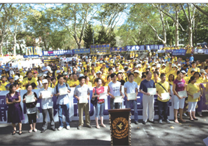
2010年9月4日，曼哈顿声援八千万三退集会上，十多人公开三退