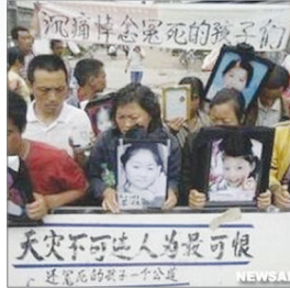
四川地震受难者家属： 人为最可恨

2003年非典席卷全球，导致八千多人感染，八百多人死亡。直到北京301医院蒋彦勇向美国《时代》杂志揭露中国的非典疫情，全球才了解到疫情远比中共公布的严重，但已丧失控制疫情最佳时期。2008年5月12日，四川汶川发生地震。震前中科院耿庆国等多位地震专家曾多次上书中央，预报四川将发生大地震，奥运前为稳定人心，中共隐瞒预警。