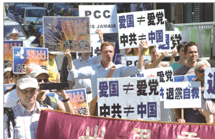
8月20日，来自欧洲多个国家的民众在巴黎集会游行，声援一亿勇士三退