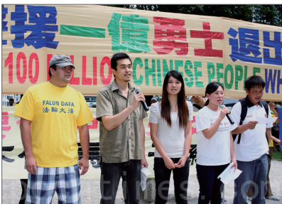
2011年8月13日，5名已三退的华人参加多伦多退党集会声援三退大潮