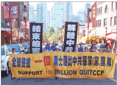
8月20日，温哥华民众举行集会及游行，庆祝一亿民众三退