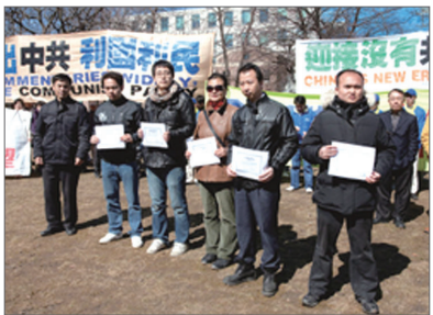
2011年3月19日，6名华人在加拿大退党集会上宣布三退