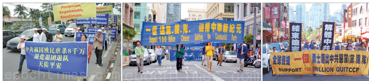
全球各地纷纷举行声援逾亿人三退活动，由左至右为马来西亚、旧金山、温哥华

这一巨大的精神觉醒浪潮，给中国民众无穷的勇敢和真实的希望。将会有更多的中国民众会更加公开、集体的退出中共。逾一亿中国人的三退也让国际社会看到，一个没有共产党的新纪元即将出现，一个没有共产党的新世界即将出现。