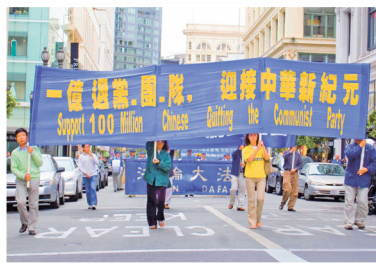
美国民众游行声援一亿人三退

六四天网负责人黄琦说：“我认为，当今中国退党人数大幅度增加，充份说明中国民众的觉醒，中国民主化进程在推进，这是任何中国大陆利益集团所无法阻挡的。”