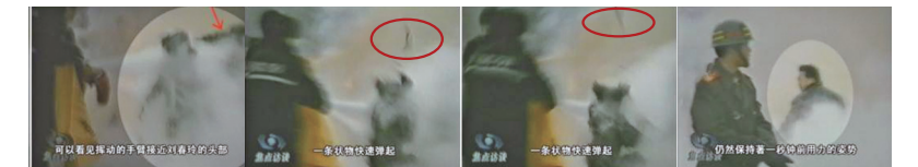
有一手臂接近刘春玲头部 有人用物体猛击刘春玲头部 一条状物快速弹起 一名男子保持用力后的姿势

自焚案详情： http://library.minghui.org/topic/2,,1.htm