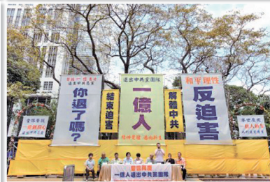
香港各界游行集会支持退出中共