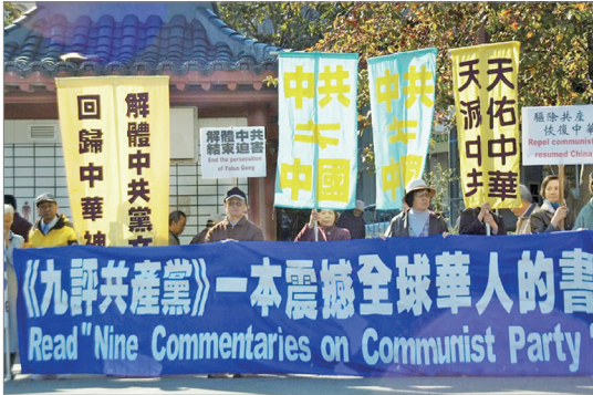
旧金山声援三退大潮集会