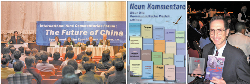
(左图起)香港九评研讨会、各国语种九评、九评获美国亚裔记者协会最佳网上报道奖

自2004年11月19日，大纪元发表系列社论《九评共产党》至今已七年，《九评》全面剖析中共的历史，揭示其反人类、反宇宙的邪恶本质。唤起中国民众的精神觉醒，并引发中国民众的三退（退党、退团、退队）大潮，截至2011年