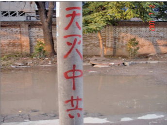
河北石家庄三退标语