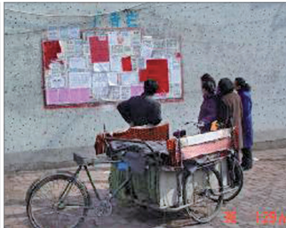
吉林民众观看张贴的三退声明