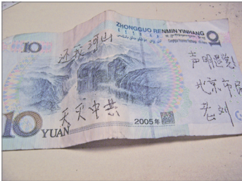
人民币上的三退声明

一亿三退人士有不少来自政、军、特与喉舌传媒，包括中共高层。这些都是中共维系统治的核心力量，比老百姓更知道中共政权的真实情况，从这些体制内官员相继公开声明退党，即可得知中共大势已去、解体已成定局。