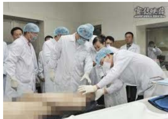
王立军 2008 年 6 月调任重庆，指示重庆警局要加快无创伤解剖的实践应用。 15