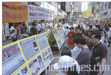
香港法轮功学员讲真相

2004年底大纪元时报《九评共产党》首次系统的向世人揭露了中国共产党反天、反地、反人、反自然的邪恶本质，是个为祸世间的邪灵。这个无法无天的邪党正在毁灭着中国社会和中国人的一切，多年来法轮功学员顶着巨大的压力，不断地讲真相劝三退，为的是希望世人能看清共产党的邪恶面目，不受中共谎言欺骗，清除人对神佛犯下的罪恶，让世人得救，这是对生命最大的慈悲。