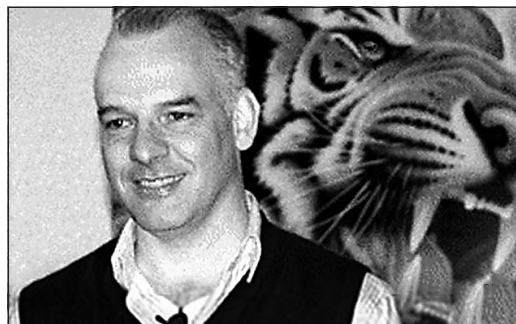
圖：海伍德案不是薄熙來垮臺主因。

我在此提出一個符合邏輯的推論。胡錦濤要阻擊薄熙來入常，所以先從王立軍查起（這和毛要搞掉林彪之前，先去搞黃永勝、吳法憲等人一樣）。王立軍在1月18日時發現自己已深陷麻煩，需要薄熙來的保護，於是去找薄熙來。而薄熙來卻準備拋棄王立軍。王立軍其實保留了海伍德死於謀殺的證據（如：血液、