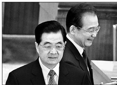
4 3月15日，胡溫迎戰政法委，拿下薄熙來。