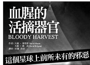
5 3月23日，百度一度解禁「活摘器官」等。