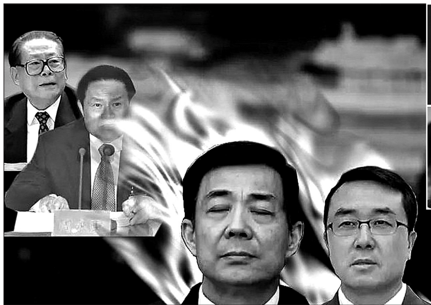
圖：王立軍事件暴露出江澤民策劃的「先樹習近平、再換薄熙來」的政變內幕，以此達到對法輪功有血債的中共官員掌控中國最高權力的目的。大戲曝光了薄熙來、周永康，現進入第三幕——江澤民開始登臺。

中共十七大前夕，中共財政部長金人慶突然出事，據了解，與金人慶和江澤民前些年把國庫的錢轉到國外有關，當時胡、溫正在徹查近1,000億人民幣去向問題。江動用大量的資金鎮壓法輪功，當年就未經過朱鎔基