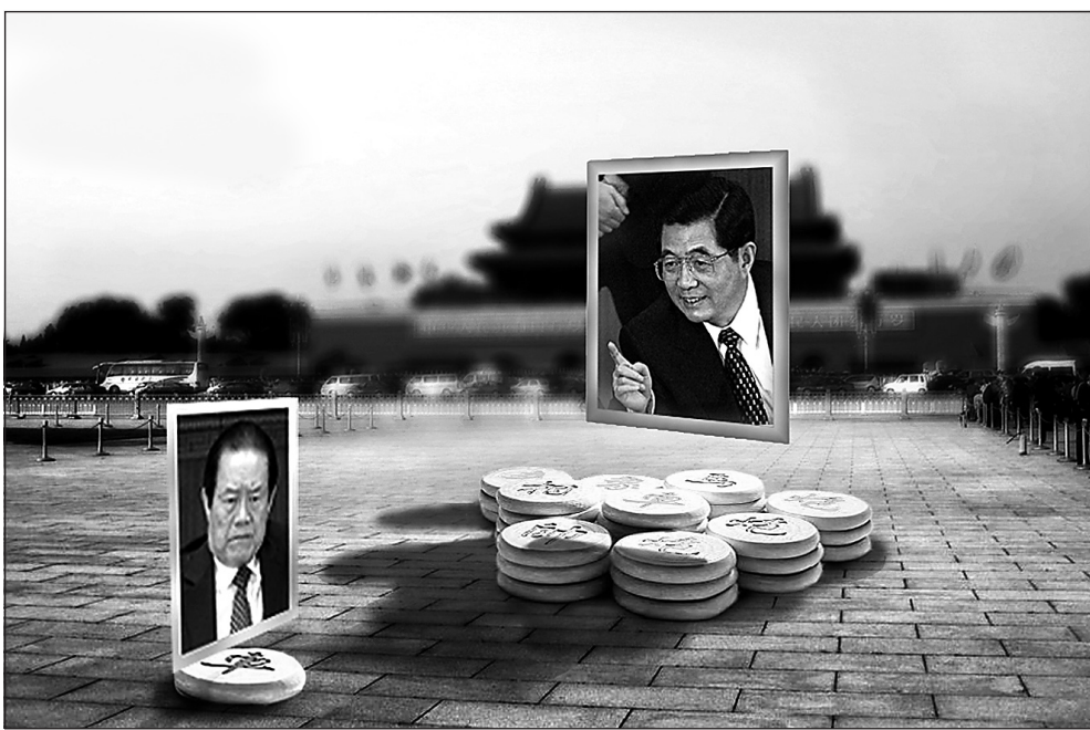
圖：薄熙來、周永康政變陰謀曝光後，江系人馬紛紛倒戈，周永康面臨絕境。

儘管如此，李長春還是不想讓王立軍案再「查下去」。因為李長春在任廣東省委書記期間，追隨江澤民迫害法輪功，在愛爾蘭、法國等地被法輪功學員以「酷刑同謀罪」告上法庭，