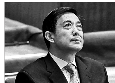
6 4月10日，薄被立案調查，稱周永康是老闆。