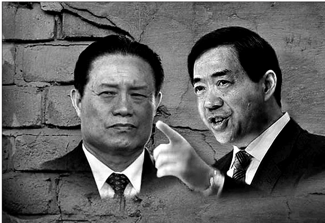
圖：野心勃勃的薄熙來和周永康密謀政變，計劃先奪取十八大政法委書記職位，然後搞掉習近平，取而代之。薄差點成為中共最有權勢的人。

2011年11月10日，正值胡錦濤到夏威夷開APEC會議，重慶大搞軍事演習，與薄熙來一起觀摩的有中央軍委委員、國務委員兼國防部長梁光烈，成都軍區司令員李世明等多個軍方巨頭。