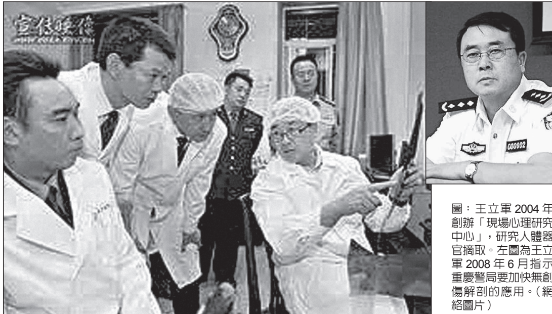
圖：王立軍2004年創辦「現場心理研究中心」，研究人體器官摘取。左圖為王立軍2008年6月指示重慶警局要加快無創傷解剖的應用。(網絡圖片)

網上流傳一份王立軍的病情診斷證明書，指他2008年開始長期睡眠不足，晚上不敢開燈睡覺。據悉，參與器官移植的醫生，很多都出現了類似病態：長期失眠、盜汗、做噩夢等。就像老百姓常說的：害死的人太多，自然有鬼找上門。作惡太多的人不得善終。◇