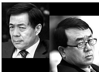
1 2月6日，薄王翻臉，王立軍逃美領館。