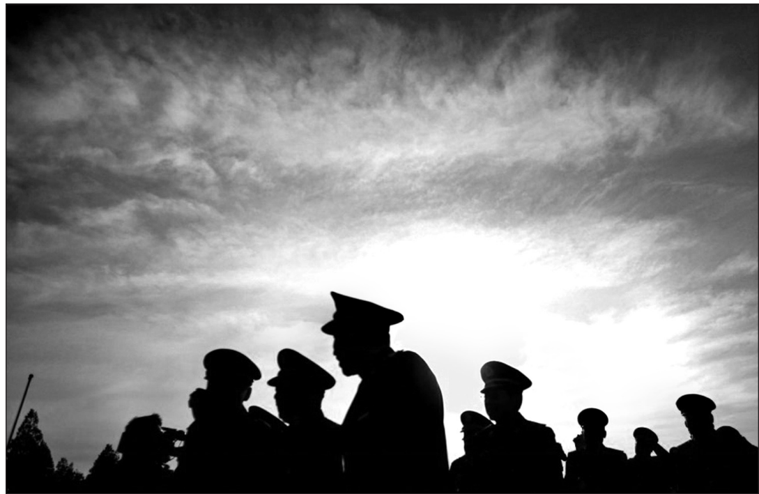
圖：《解放軍報》宣布十八大之前軍隊「頭等大事是維護大局」，這意味著國家正規軍的責任在目前特別狀態下轉向內政。

日常運作由周永康轄下的政法委管理，周永康被爆經常故意製造事端來調動更大規模的警力，前一段時間《北京日報》選刊文要求改變政法系統調動武警部隊事先需軍委審批的程序，