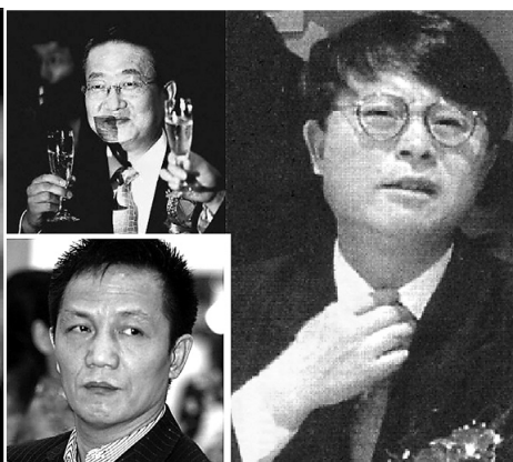
圖：被中國老百姓稱爲「中國第一貪」的江綿恆（右）涉及劉金寶（左上）、周正毅（左下）等多起重大貪污要案。2011年11月18日中共官方發布消息，指江綿恆不再擔任中國科學院副院長職務。（合成圖）