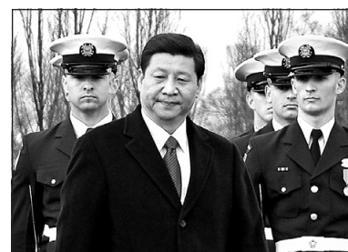
3 2月15日，習近平訪美，美官員披露薄周謀反。