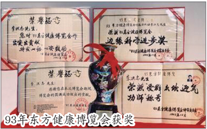
93年东方健康博览会获奖