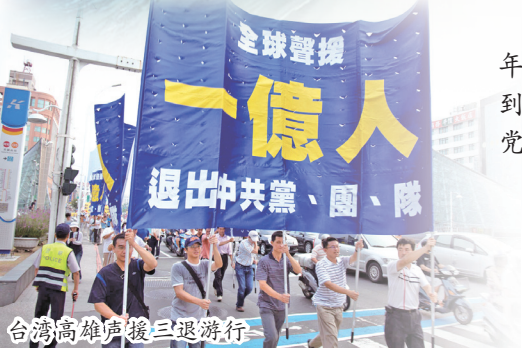
台湾高雄声援三退游行