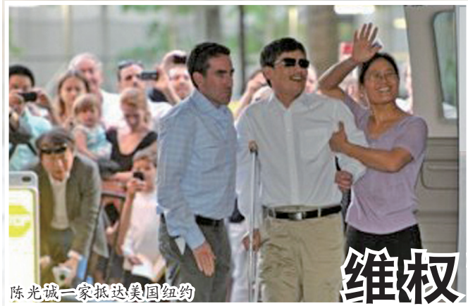
陈光诚一家抵达美国纽约

2012年4月22日凌晨，山东盲人维权律师陈光诚在支持者帮助下逃离严密监控的家乡东师古村，27日进入美国驻北京使馆寻求庇护，成为国际各大媒体头条。