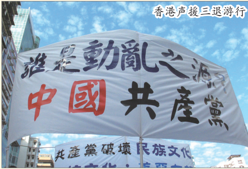
香港声援三退游行

呼声巨大，高层急剧分裂。中共带给中国的只有谎言、暴力、血腥与恐惧，是中国一切灾难的根源。所谓的“和谐社会”、“维稳”都是中共为维持手中权力营造的谎言，事实上，中共存在的本身就是社会不稳定、不和谐的根本原因。