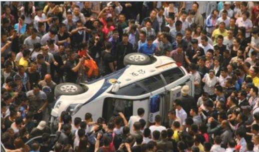
黑龙江绥化交警打人，民怨爆发怒砸警车

研究报告，披露1990年代中期以来，大陆党政干部及驻外中资机构的外逃和失踪人员约1.6万至1.8万人，携走款项高达人民币8,000亿元。