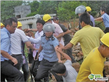
湛江东海岛官方人员对多条村进行强徵暴拆，上万村民积怨已久