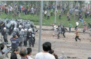
重庆双桥农民维权遭警察殴打

六万起；2006年到2010年，由九万起增加到十八万起。中共正坐在民众抗议的火山口上。