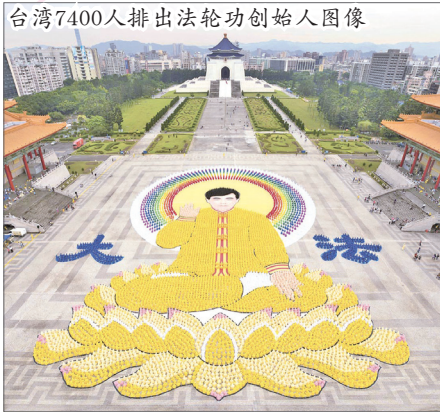
台湾7400人排出法轮功创始人图像

法轮功至今洪传114个国家和地区，国际社会为表彰李洪志先生和法轮大法对人类身心健康所作出的杰出贡献，纷纷给予褒奖支持。至今获得来自世界各地褒奖1793份，361个支持议案，1170封支持信函。法轮大法主要著作《转法轮》被译成近40多种文字出版发行。