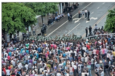
什邡二万市民抗污染被血腥镇压

幼”，其暴力程度可见一斑。在什邡事件中，学生们喊出：“我们可以牺牲，我们是『90后』！”的口号红遍网络。