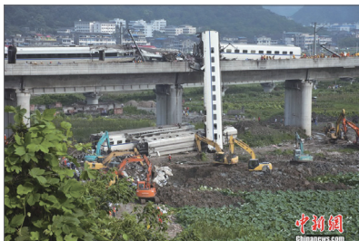
温州动车追尾事故造成重大伤亡

北京7.21雨灾遇难者头七，官方没举行任何悼念活动。27日天津举行的中超球赛北京国安对天津泰达，两队球员和球迷原拟在赛前为遇难者默哀，却被有关部门禁止。球员纷感无奈，球迷更是怒不可遏。