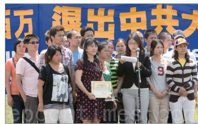
7月13日，美国华盛顿举行“停止迫害法轮功 声援九评退党”集会。19位华人现场三退并领取退党证书。

巨变。2月重庆事件爆发，王立军闯成都美国领事馆，引发中南海政治海啸。4月薄熙来下台。进入7月，每一个日子都令中共心惊胆颤：四川什邡、扬州地震、北京大水、启东十多万民众占领市政府…。