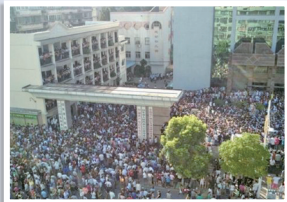
江苏启东十万人抗议污染