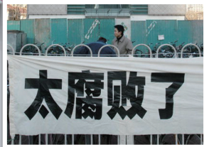
北京秀水街民众抗议中共腐败