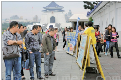
大陆游客在台湾中正纪念堂看真相资料

大陆旅游团一到景点，游客们就忙着找真相资料，追着义工要《大纪元时报》等有关中共高层内斗的特刊，经常出现全车人都做了三退的现象。