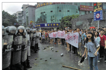
四川什邡民众抗议兴建钼铜冶炼厂

现今造成中国社会的各种矛盾日益尖锐，中国的群体性事件在2009年已逾28万起。中共已经陷入深重的政治和经济危机。为了维持共产党的非法统治，每年中共用于维稳的巨额开支已经超过6000多亿的军费