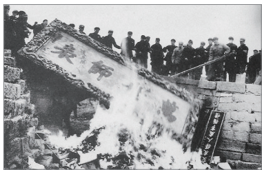
文革中纵火焚烧孔庙文物

我们被强迫信仰来自西方的垃圾主义，被强迫拜马、恩、列、斯、毛这几个吃人恶魔为神，我们被强迫接受剧毒无比的红色文化大洗脑，从天上到地下、从课堂到社会、从报纸到电视，无处不在、无处躲藏。”