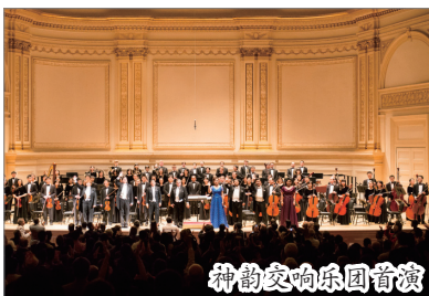
神韵交响乐团首演

2012年10月28日下午,神韵交响乐团在纽约被誉为“全世界最伟大的音乐厅”卡耐基首演,当日场内爆满,演出结束观众全体长时间站立鼓掌。