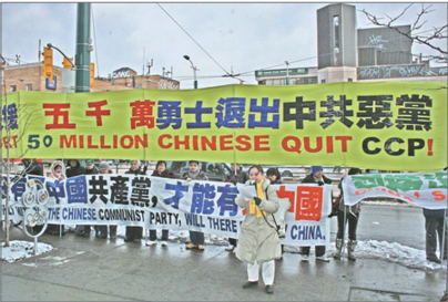
多伦多声援五千万人三退集会