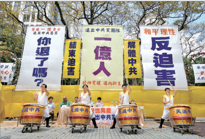
香港集会见证一亿人三退大潮