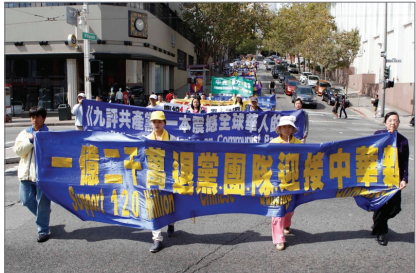
旧金山游行声援一亿二千万人三退