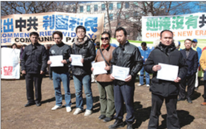
2011年3月19日，6名华人在加拿大退党集会上宣布三退

随着退党大潮的推进，觉醒的大陆民众逐渐摆脱对中共的心理恐惧，支持正义的行为越来越公开化，选择真名三退。在海外声援退党集会上许多华人踊跃公开退出中共。