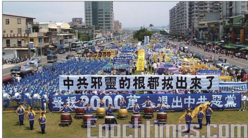
台湾声援二千万人三退集会