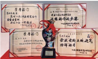
93年东方健康博览会“边缘科学进步奖”和大会“特别金奖”及“受群众欢迎气功师”称号。

修炼法轮功的民众，不但改善身体状况，为国家节省大量医疗费，而且遵循真善忍法理，不计个人得失、善待他人。经亿万人的修炼实践证明，法轮大法是大法大道，在把真正修炼的人带到高层次的同时，对稳定社会、提高人们的身体素质和道德水准，也起到不可估量的正面作用。