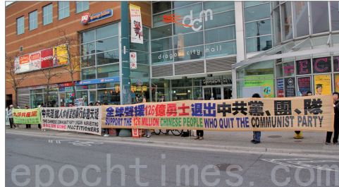
左:韩国首尔明洞举行集会游行声援中国民众三退,右:加拿大多伦多展出真相长城活动

2004年11月大纪元时报发表评论《九评共产党》后,引发中国民众退出中共党、团、队大潮。至2012年10月底,三退人数已突破一亿二千六百万。