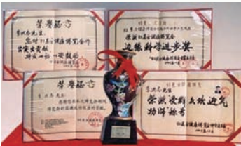
93年东方健康博览会“边缘科学进步奖”和大会“特别金奖”及“受群众欢迎气功师”称号。

修炼法轮功的民众，不但改善身体状况，为国家节省大量医疗费，而且遵循真善忍法理，不计个人得失、善待他人。经亿万人的修炼实践证明，法轮大法是大法大道，在把真正修炼的人带到高层次的同时，对稳定社会、提高人们的身体素质和道德水准，也起到不可估量的正面作用。