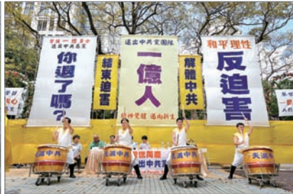
香港集会见证一亿人三退大潮