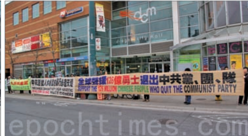
左:韩国首尔明洞举行集会游行声援中国民众三退,右:加拿大多伦多展出真相长城活动

2004年11月大纪元时报发表评论《九评共产党》后,引发中国民众退出中共党、团、队大潮。至2012年10月底,三退人数已突破一亿二千六百万。