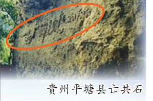
贵州平塘县亡共石

持着十几亿中国人滑向死亡的深渊。加入中共党、团、队的人，也就是被中共魔教打上兽印的人，他们将面临不幸的命运！如何脱离险境，走下中共的死亡通车，免于做中共的陪葬品？！