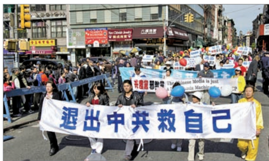
纽约声援中国三退大潮游行

善恶有报是天理，当我们目睹中国社会如此多权势者无法无天时、人心可以如此伤害他人时、面临如此不仁不义的迫