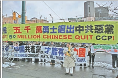
多伦多声援五千万人三退集会