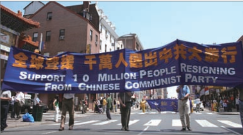
三退人数超过千万 美国费城举行游行声援