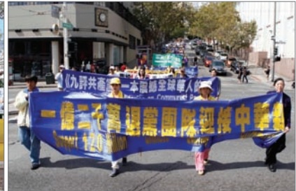
旧金山游行声援一亿二千万人三退