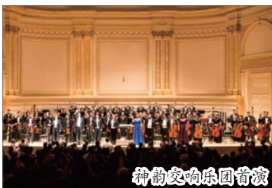
神韵交响乐团首演

2012年10月28日下午,神韵交响乐团在纽约被誉为“全世界最伟大的音乐厅”卡耐基首演,当日场内爆满,演出结束观众全体长时间站立鼓掌。