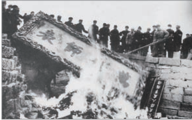
文革中纵火焚烧孔庙文物

中共建政后发动多次政治运动，从土改、三反五反、反右、大跃进带来的三年大饥荒、文革、到“六四”镇压学生等，除导致八千万中国人非自然死亡外，中共带给中国最大灾难，是中华传统文化被摧毁，善恶标准颠倒、道德沦丧。从此暴力替代文明、谎言替代真相、党性替代人性、共产党的政治指令替代良知善恶的判断。高强度与频率的斗争、控制、暴力高压，打垮国人的脊梁，即使面对罪恶与不公不义，人们也往往忍气吞声。