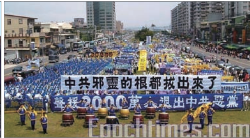
台湾声援二千万人三退集会