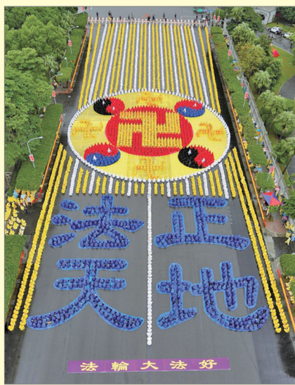
2012年11月台湾六千人在总统府前排字