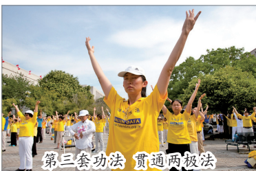
第三套功法 贯通两极法