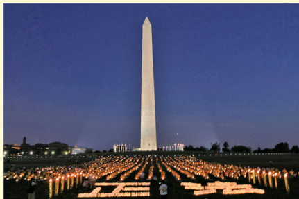
2008年7月美国林肯纪念碑举行烛光夜悼