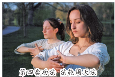
第四套功法 法轮周天法