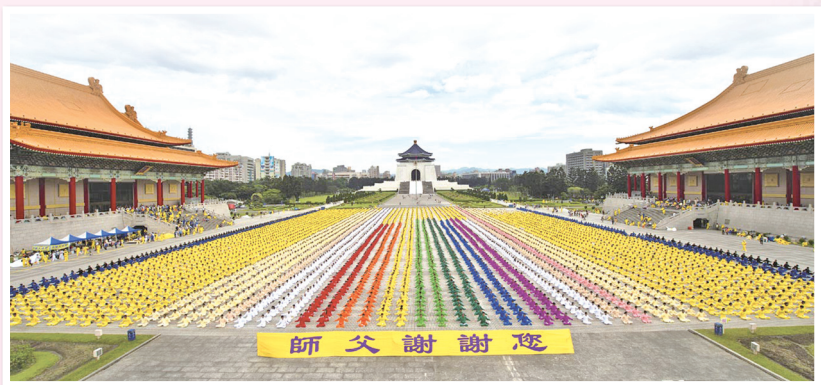
2012年台湾七千多名法轮功学员集体炼功