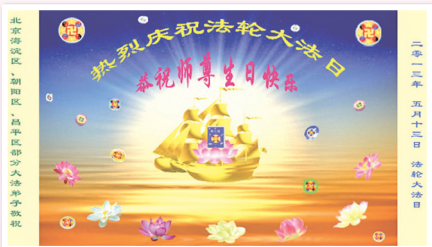
大陆法轮功学员制作的贺卡