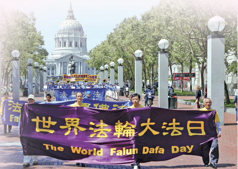
旧金山法轮功学员庆祝513游行

5月13日已不仅仅是法轮功学员的节日，已成为一个世人同庆“真、善、忍”普世价值的日子！