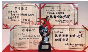
93年东方健康博览会李洪志老师荣获“边缘科学进步奖”和大会“特别金奖”及“受群众欢迎气功师”称号。

各界颁与的各类褒奖合计1795项；支援的决议案367件；支持信函累计1171封。