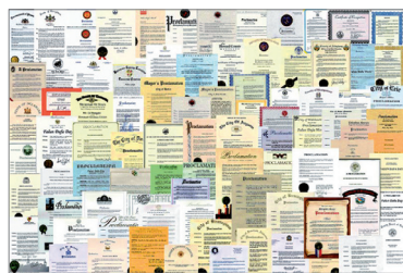
海外各界对法轮功的褒奖