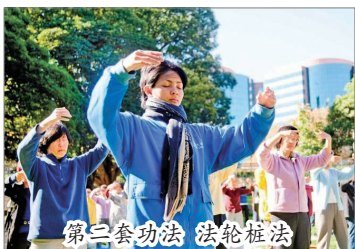
第二套功法 法轮桩法