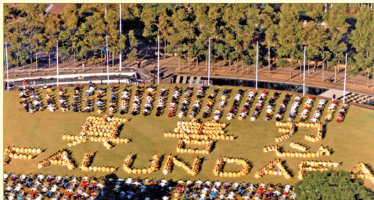
1999年5月澳大利亚心得交流会期间排字