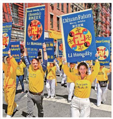
各地以舞蹈、游行、舞龙等活动庆祝世界法轮大法日

长春市电力局的一位领导执笔表达祝愿，写下：祝师父生日快乐！心想事成！中国武警边防部队明真相的五名干部感谢法轮大法师父给人类带来希望、给世界带来美好！