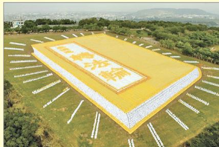
2009年11月台湾六千人排《转法轮》