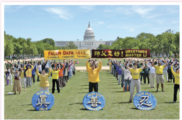
2013年华府法轮功学员庆祝法轮大法日

从亚太地区到欧洲、北美、大洋洲等地海外法轮功学员则以歌曲、舞蹈、功法演练、庆典游行、乐团演