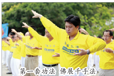
第一套功法 佛展千手法

法轮功不收礼、不收费，义务教功。《转法轮》包含从修炼入门到修炼圆满所需的一切法理，学炼者只要不断反覆通读就会逐渐领悟到修炼所需许多的高深内涵。法轮大法有五套功法，佛展千手法、法轮桩法、贯通两极法、法轮周天法、神通加持法。在《法轮大法大圆满法》里有对功法特点的讲解、动作图解和机理。