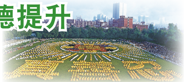
1997年武汉五千多名法轮功学员排字炼功

以乔石为首的部份中国全国人大离退休老干部，对法轮功进行详细调查和研究，最后得出“法轮功于国于民有百利而无一害”的结论。