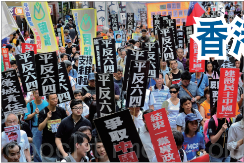
香港纪念六四游行

今年3月21日，澳洲参议院通过要求澳洲政府支持联合国和欧理会的倡议并反对活体摘取器官的行为的动议案。