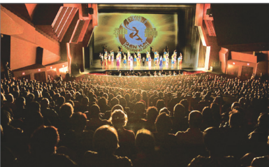
神韵巡回艺术团在美国加州大洛杉矶地区的演出连场爆满

2013年“世界第一秀”神韵艺术团以纯善、纯美的中国古典舞、中西乐器合璧的现场交