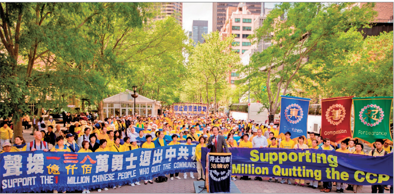
各界人士在纽约联合国前集会