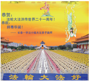
全球各地以舞蹈、游行、排字、贺卡等方式庆祝世界法轮大法日