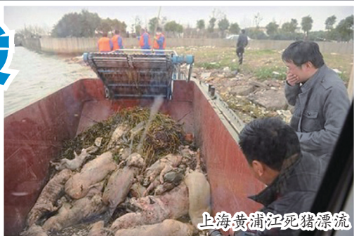
上海黄浦江死猪漂流