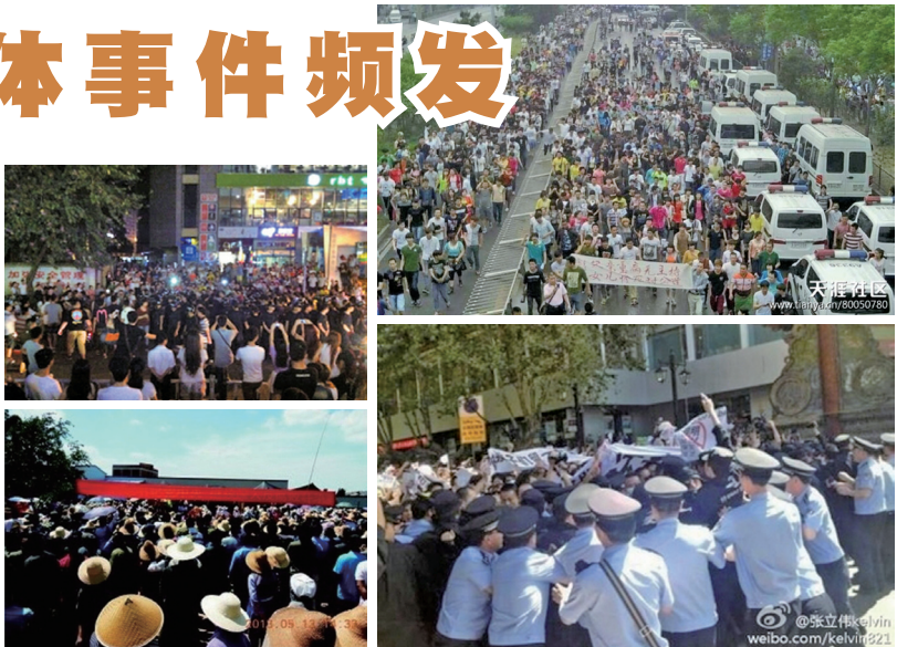
左上:广西南宁市城管殴打小贩引发上千民众抗议 左下:云南昆明市万人维权抗暴集会 右上:北京京温商城数千人游行 右下:云南数千民众抗议PX项目

和路国贸夜市发生城管暴力殴打摆地摊小贩受伤事件，引发逾千民众愤怒声讨，警察和抗议民众发生激烈冲突。