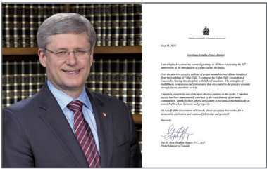
加拿大总理哈珀为法轮大法日和法轮大法月发来贺信

每年“世界法轮大法日”之际，来自世界各国的褒奖与支持，映衬着光辉的五月；举世同颂大法的盛况，标明了世人明了真相后的良知觉醒。面对中共的残酷迫害，法轮功学员坚持不懈的捍卫“真、善、忍”价值，已使无数的善良人们秉于道德，发出正义呼声，共同为制止迫害留下永恒的历史见证。