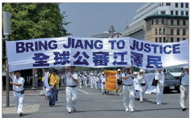
法轮功学员于华盛顿DC大游行