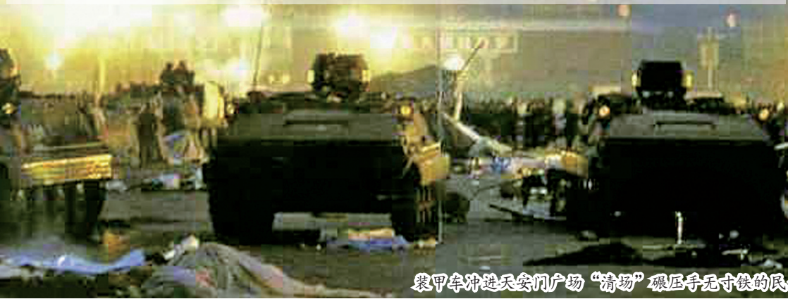
装甲车冲进天安门广场“清场”碾压手无寸铁的民众