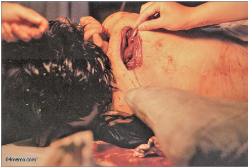
中共用国际禁用俗称“炸子”的达姆弹攻击民众