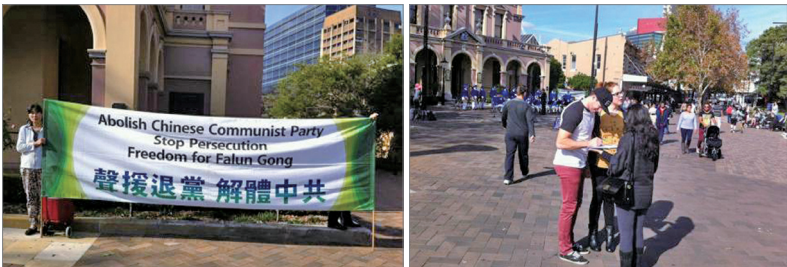
上排图：新西兰民众庆祝一亿四千万人三退，民众观看路边的展板，对中共所犯下的种种罪恶深感震惊。下排图：澳洲悉尼退党服务中心举办各界声援一亿四千万勇士三退真相长城和现场签名声援退党活动。