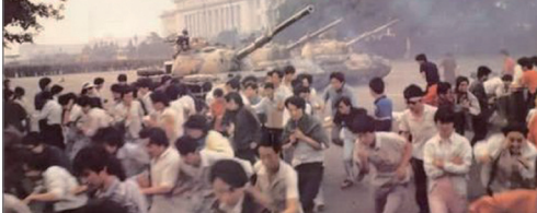
中共坦克在天安门广场对爱国学生进行血腥屠杀