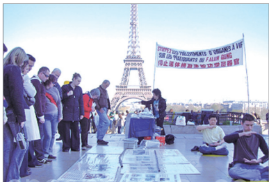
法国巴黎艾菲尔铁塔前民众了解真相

这位游客说，“今天是‘六四’，国内的反抗声音都沸腾了，如果有人带领反独裁、反腐败中共一定垮台。中共骗子的嘴脸百姓都看清了，现在如果你们带头，我们国内全都会起来响应。总有一天我们会在北京天安门相见，把毛的相片摔下来！”随后这名游客拿了真相资料并做了三退。