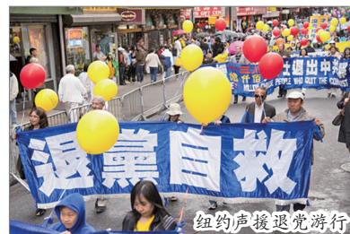
纽约声援退党游行