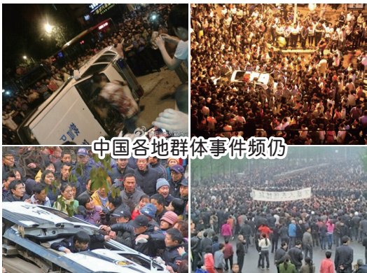
中国各地群体事件频仍