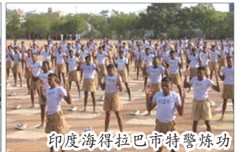
印度海得拉巴市特警炼功