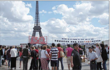
巴黎艾菲尔铁塔下游客办理三退

7月是欧洲的旅游旺季，许多景点的中国大陆游客人数暴涨，每天都有大批中国游客在游览区的退党服务点办理“三退”。欧洲旅游旺季成了大陆游客的“退党旺季”。