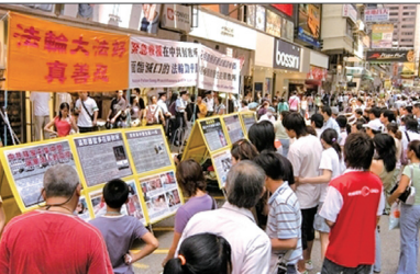
香港真相点展版吸引游客观看

和义工交谈，想了解更多的真相。旁边一位游客也在听义工讲，只见他扬手招呼刚刚下车的人：“你们快过来，都过来听听，听听人家说的这些事情，国内你听不著啊！”他请义工把刚才讲的那些事再对大夥说说。整车游客都接了真相报，不少人退了。