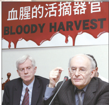
血腥的活摘器官 BLOODY HARVEST 大卫·乔高(左)与大卫·麦塔斯在台北举行《血腥的活摘器官》发表会。

加拿大前亚太司司长大卫·乔高和国际人权律师大卫·麦塔斯出版《血腥的器官摘取》：“中共利用政府、军队、医院的体制，大面积的、而不是个别的，从被监禁的、活着的中国法轮功学员身上摘取器官。其血腥程度令人发指。”