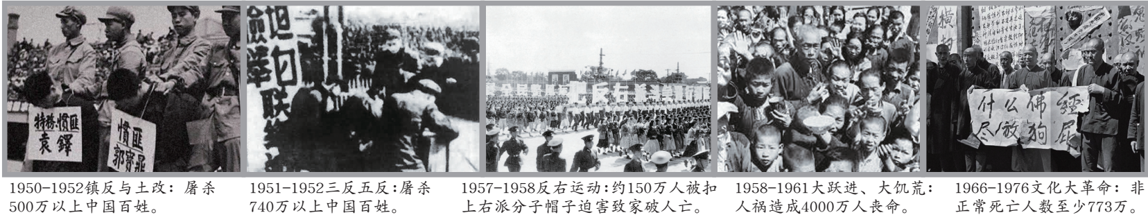
1950-1952镇反与土改：屠杀500万以上中国百姓。 1951-1952三反五反：屠杀740万以上中国百姓。 1957-1958反右运动：约150万人被扣上右派分子帽子迫害致家破人亡。 1958-1961大跃进、大饥荒：人祸造成4000万人丧命。 1966-1976文化大革命：非正常死亡人数至少773万。