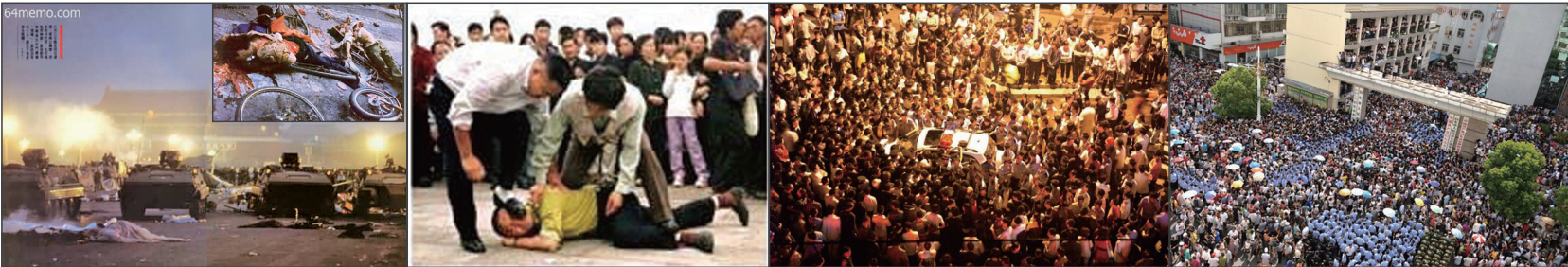
1989年6月3日晚至4日凌晨，中共装甲车冲进天安门广场“清场”，死伤无数。 中共迫害法轮功学员 污染、强拆、征地已经到疯狂、肆无忌惮的地步，司法黑暗，民怨沸腾，群体事件频仍。

回顾中共执政历史，走的都是同一条路，丝毫没变过。中共用阶级斗争理论和暴力革命学说，不断消灭不同范围和群体中的异己分子；至今对法轮功、少数民族、维权人士仍在进行迫害。其谎言与暴力的邪恶本质从未改变！