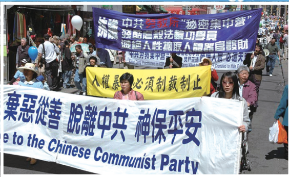
纽约声援中国三退大潮游行

有一次义工在景点大巴停车场，给来往大陆客发真相报纸。一个山东团的游客告诉义工，自己退过了，是他最好的炼法轮功的朋友帮他退的。他