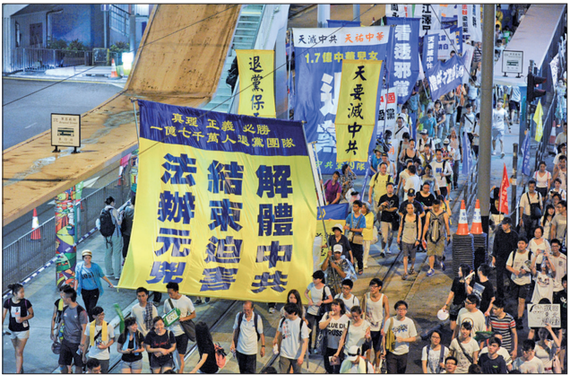
香港7.1游行中，法轮功学员打出声援一亿七千万人三退横幅。

“国家兴亡匹夫有责，你选择退出中共，也就是削弱了中共的一份力量。可以说，三退大潮是和平改写中国历史的壮举，更是现代中国人的自我精神救赎。”