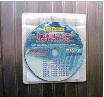
山西太原市某公园张贴的九评光盘

半个多世纪以来，中共严密封锁历史真相，对中国人进行洗脑灌输。人们阅读《九评》时，在人心回归善良与正统之际，就得以识别正邪，从恐惧中走向觉醒。大陆退党义工表示，现在大陆民众接受真相并三退越来越容易，包括很多政法、公安系统人士；在海外大陆游客整团三退现象很普遍；真名登记三退的人多了，中国民众从原本只敢在自己家中小心讨论中共，到如今人们开始有勇气直面中共。《北京青年报》“解散党组织”的新闻被外界聚焦，在中共合法性彻底丧失成为外界共识的情况下，