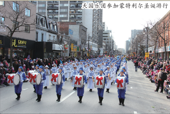
天国乐团参加蒙特利尔圣诞游行

11月21日加拿大蒙特利尔第65届圣诞大游行在蒙特利尔市中心圣-凯瑟琳大街登场，超过30万人在现场观看，是加拿大最大规模的游行活动之一。法轮大法天国乐团受邀参加圣诞大游行，并被安排在游行方阵第一位。天国乐团160人的阵容是游行中声势最为浩大的军乐团，雄壮的乐曲令观众极为震撼，沿途不时响起“Bravo（很棒）！”的欢呼声和掌声，人们随着演奏乐曲的节奏欢呼和舞动。