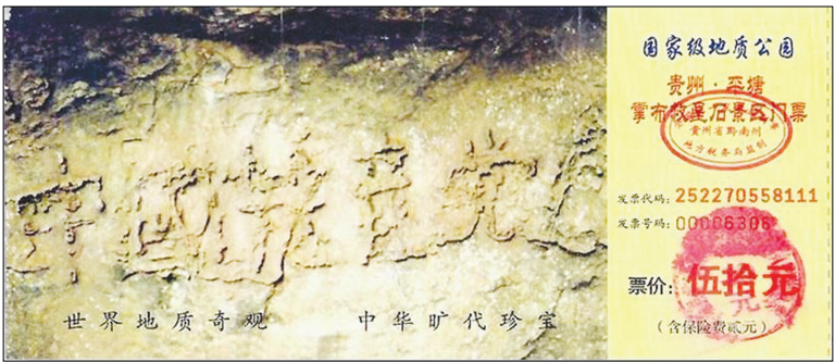
贵州藏字石风景区门票

谶语应验。天垂像，见吉凶，顺天而行，趋利避害。贵州“藏字石”的出现，上天预警昭示了上天的意愿-党之将亡，警示世人逃脱陪葬厄运，赶快退党保命。