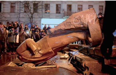
乌克兰民众将列宁的铜像推倒打碎

《九评》问世，给世界点明了原因和解决方法。近年来，从波兰、格鲁吉亚到乌克兰，前东欧社会主义国家纷纷制定法律，禁止共产党的标记及其思想和宣传，全世界范围掀起去共产主义化的浪潮。国际社会普遍认识到，在经济和军事上不断强大、却坚持共产主义意识形态和极权统治的中共政权，是对世界和平和人类安全的最大威胁。这都与《九评》的问世密切相关。尤为可贵的是，《九评》引发的三退大潮精神觉醒运动，给世界提供了和平解体中共的最佳方式。