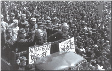
文革时期批斗场面