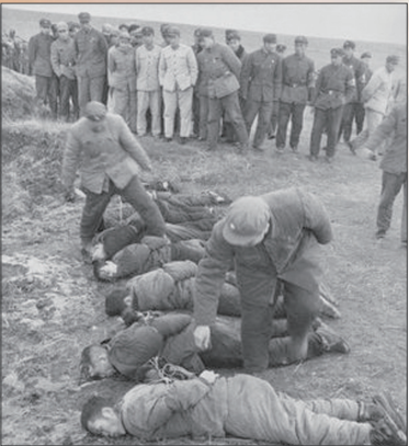
土改中以革命的名义枪杀地主

2004年11月《九评共产党》的发表就确定了中共必亡的结局。腐败并不是中共亡党的唯