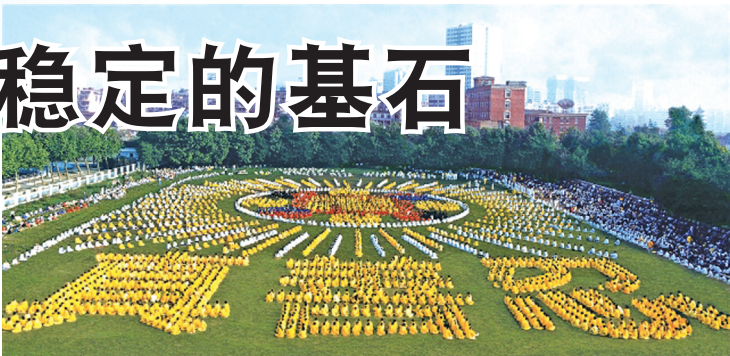
1998年武汉法轮功学员举行大型排字炼功活动

97.9%，每年节约2100万元医药费。以乔石为首的部份人大离退休老干部对法轮功进行详细调查和研究，最后得出“法轮功于国于民有百利而无一害”的结论。