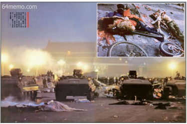
1989年6月4日装甲车冲进天安门广场镇压学生和民众，死亡逾千人。

一威胁，中共亡党是天意，是作恶多端的必然结果，是即将到来的现实。顺天者昌，逆天者亡。抛弃中共，回归中国，是所有明智中国人的选择。