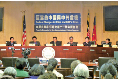
11月28日美国华盛顿DC举行大型研讨会纪念《九评》发表十一周年

目前在全球五大洲，上百座城市已举办了二千多场关于《九评》的研讨会、座谈会、新闻发布会、图片展等，上万名专家、学者、政要、领袖、媒体人、受害人纷纷站出来齐声谴责中国共产党。