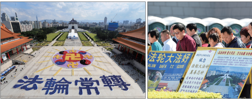
(上图)七千名法轮功学员参加台湾修炼心得交流会。(左下图)六千名法轮功学员排出“法轮图形”壮观图像。(右下图)许多游客观看法轮功真相展版。